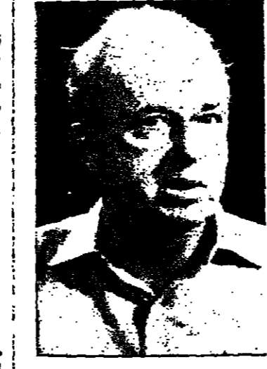
اعتبرت انذاك قيام إسرائيل لا وجبت الترة الشرق اوسطية ولا ارسمت الاصوات التي تنادي اليوم بضرورة قيام الدولة الجديدة على م من ٤٨

وذلك يوم السبت الموافق ٢٦-٤-١٩٨٠ الساعة الرابعة بعد الظهر في كنيسة الكاثوليكية في الناصرة . راجين اعتبار هذه الكتابة بمثابة دعوة شخصية للجميع لا اراكم الله مكروها بعزير